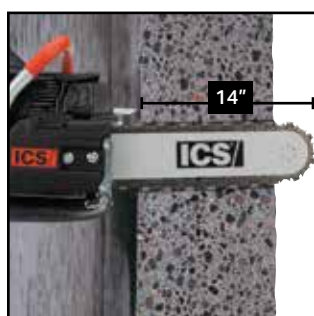
Diepzagen als oplossing voor belemmerde of kleine openingen

De verlengd aandrijftandwieladaptor biedt een gemakkelijke kettingmontage