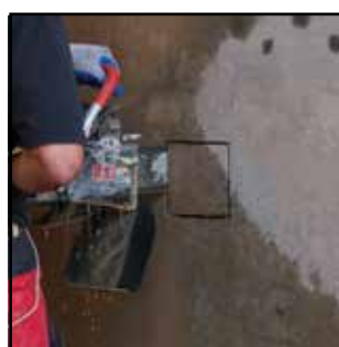
Zaag vierkantjes uit tot 4" x 4" (10 cm x 10 cm)